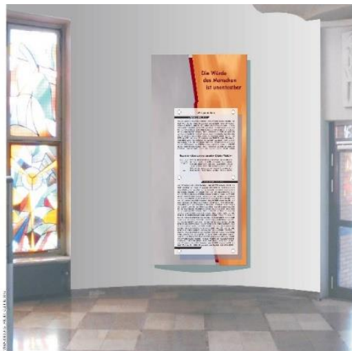
Beifüge, Eisenblech, Koloriertes Folienpapier, Gipsplatte (Gips, schwebend), Größe gemitt. 100 x 150 cm

Den Schülerinnen und Schülern ist es ein Anliegen, diese Situation durch eine Umgestaltung der Gedenkstätte zu ändern. Daher erarbeiteten sie